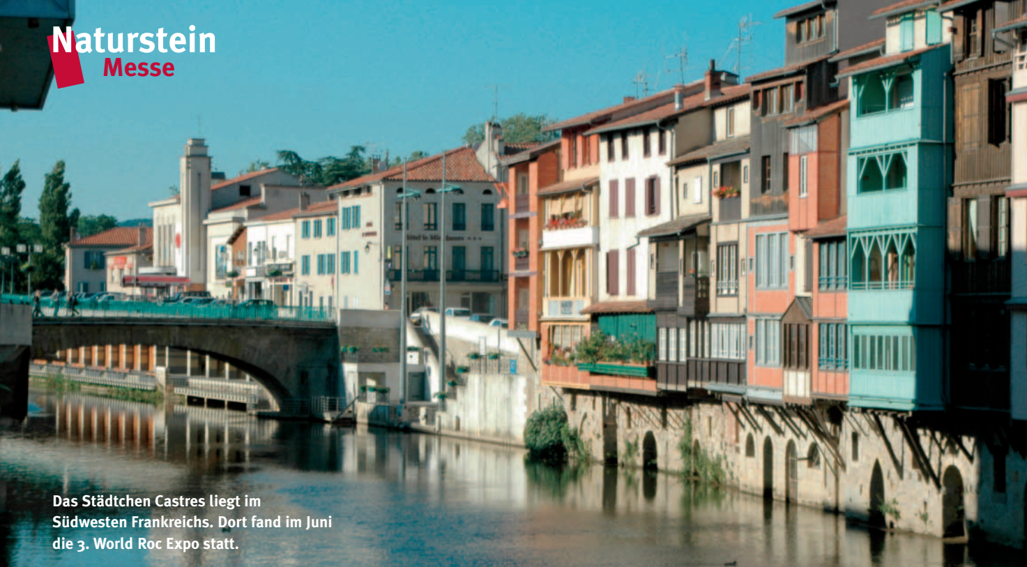
Das Städtchen Castres liegt im Südwesten Frankreichs. Dort fand im Juni die 3. World Roc Expo statt.

World Roc Expo mit Bildhauer-Symposium im südfranzösischen Castres: