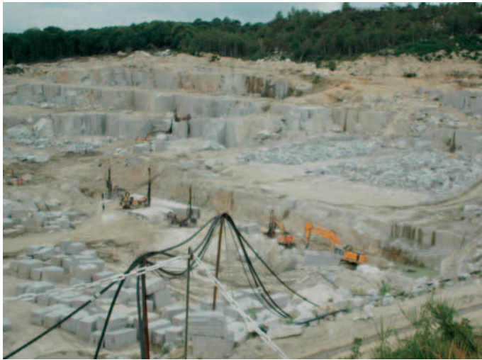
Castre liegt in einem traditionellen Granitgebiet. Im Bild ein Steinbruch der Firma Plo.